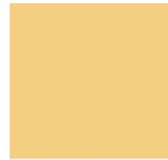
PANTONE® 7403 U